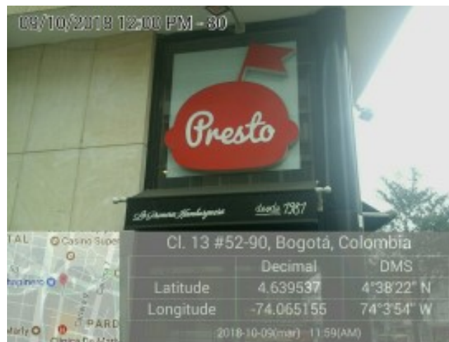
Publicidad en ventanas