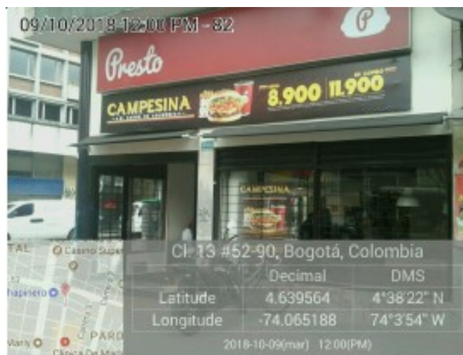
Aviso en fachada