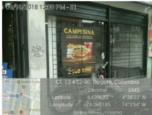
Publicidad en ventanas