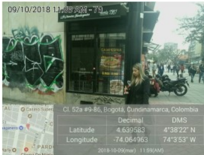
Publicidad en ventanas